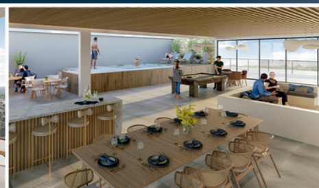
EXCLUSIVA CASA DE CAMPO