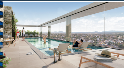
PISCINA NO ROOFTOP