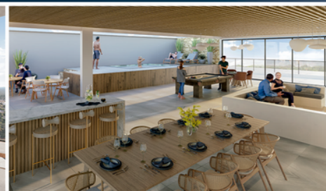
EXCLUSIVA CASA DE CAMPO