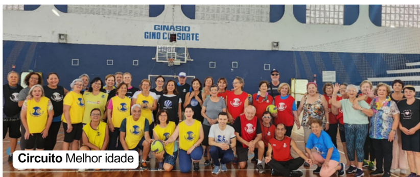
Circuito Melhor idade