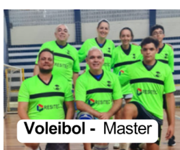
Voleibol - Master