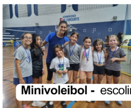
Minivoleibol - escolinhas